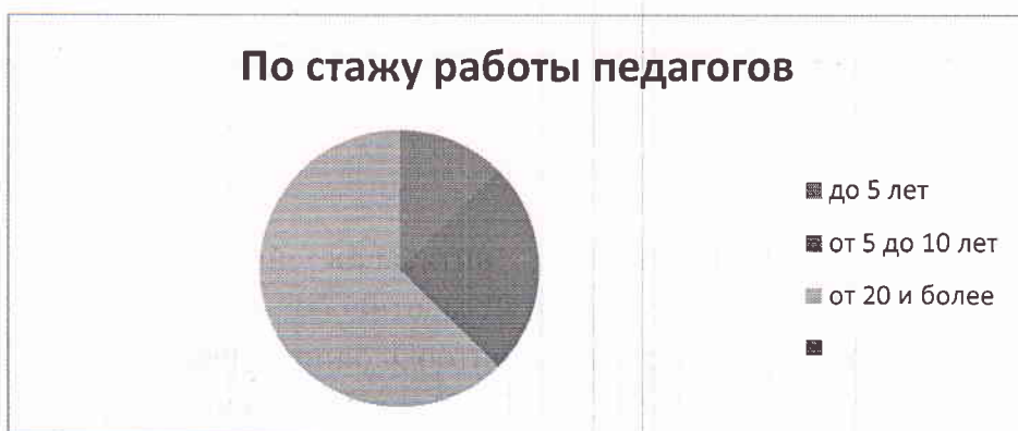
Диаграмма с характеристиками кадрового состава детского сада